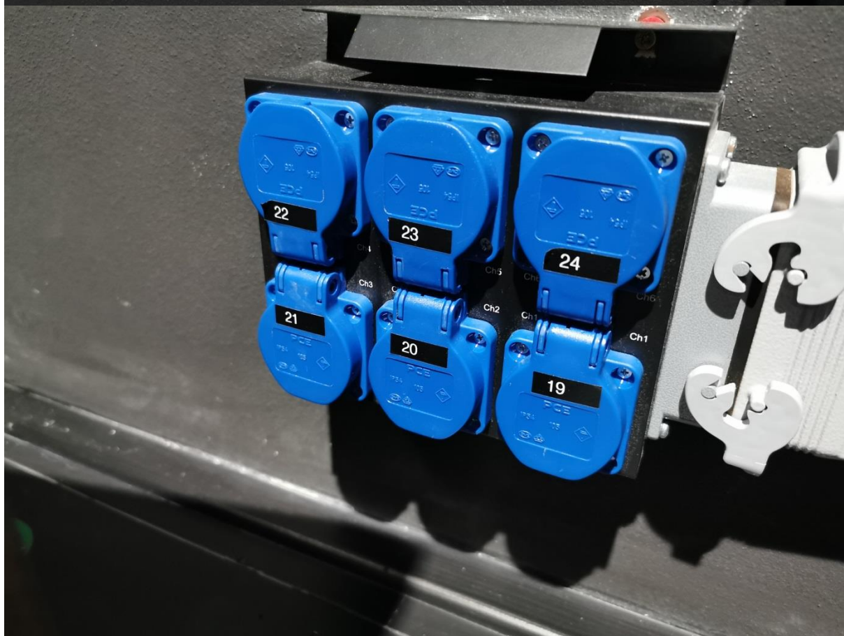
Zákulisní regulovatelné zásuvky po pravé straně z pohledu diváků