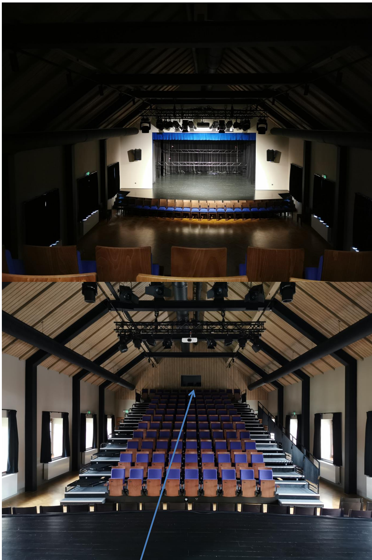
Pohled z jeviště do hlediště. Umístění kabiny