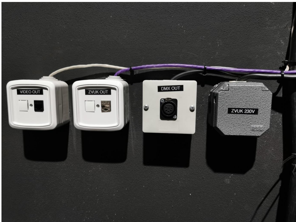
Zákulisní zásuvky po pravé straně z pohledu diváků