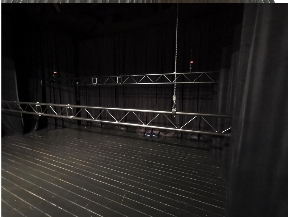
Stahovací divadelní tahy