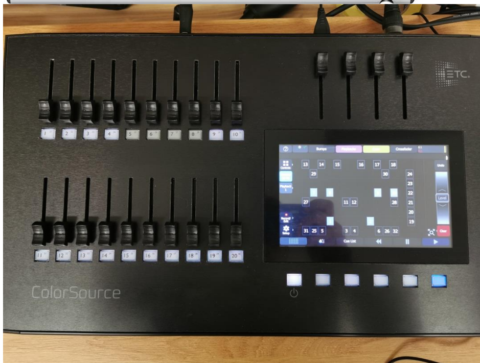
Světelný pult – ETC ColorSource 20