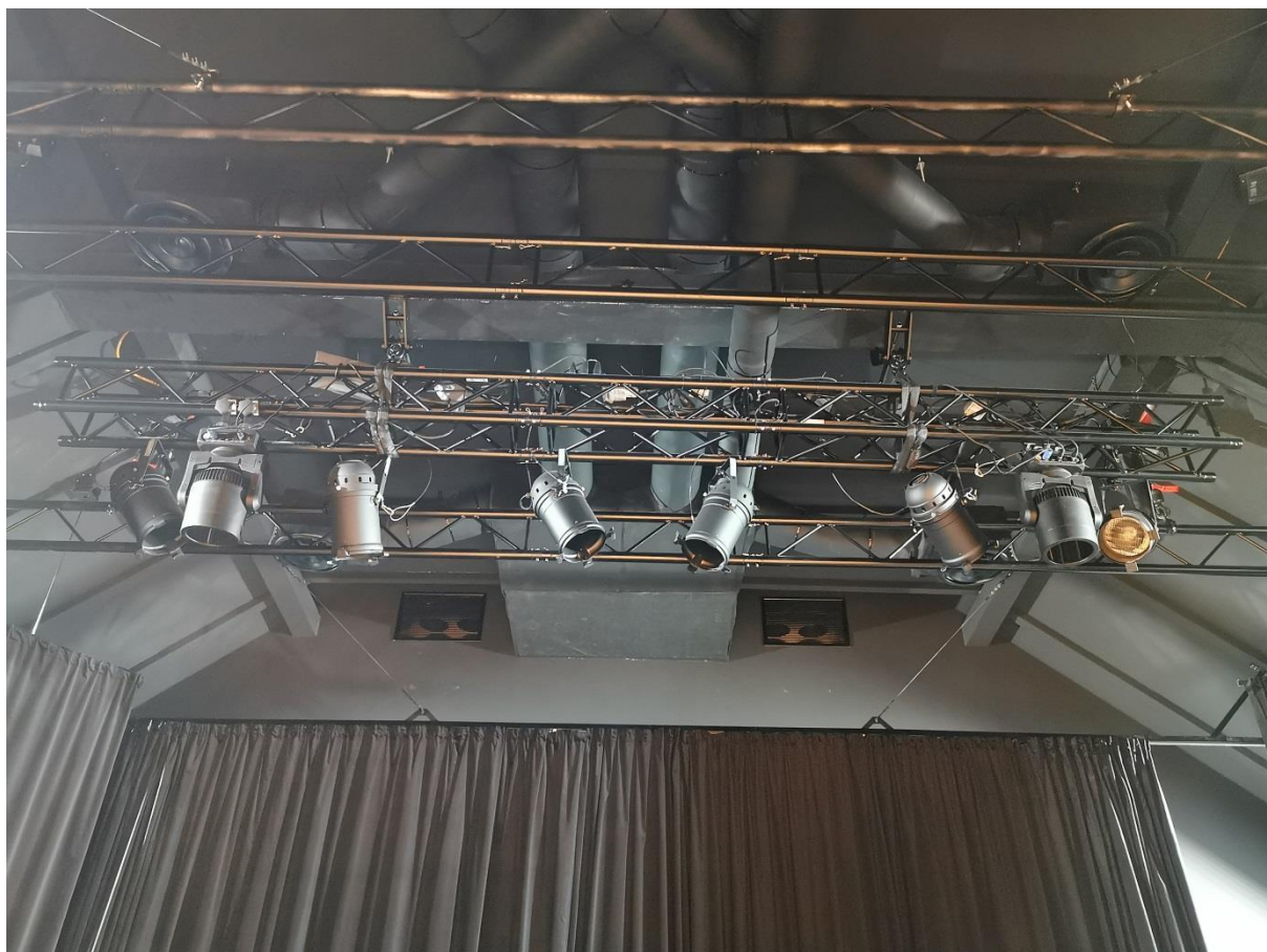
Umístění divadelních tahů