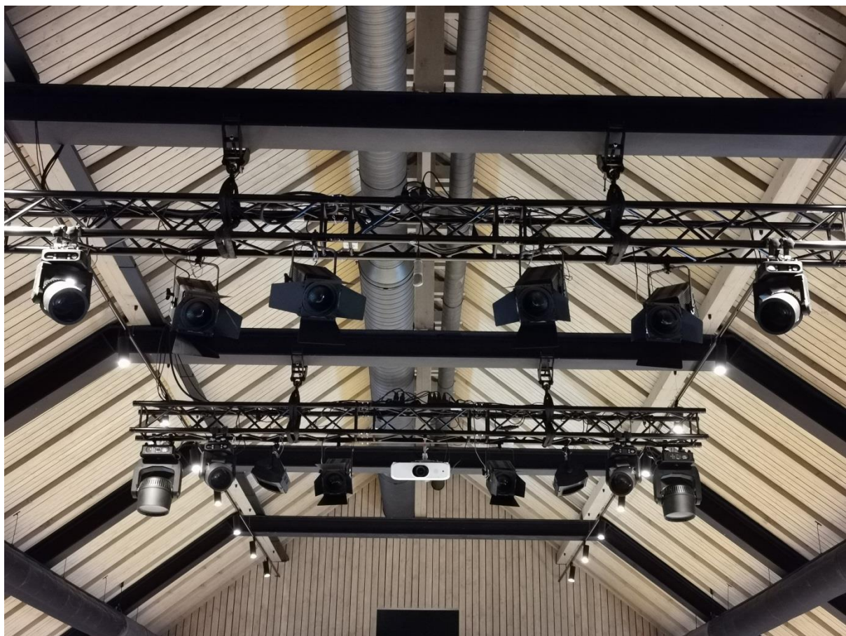
Přední světla z pohledu herců