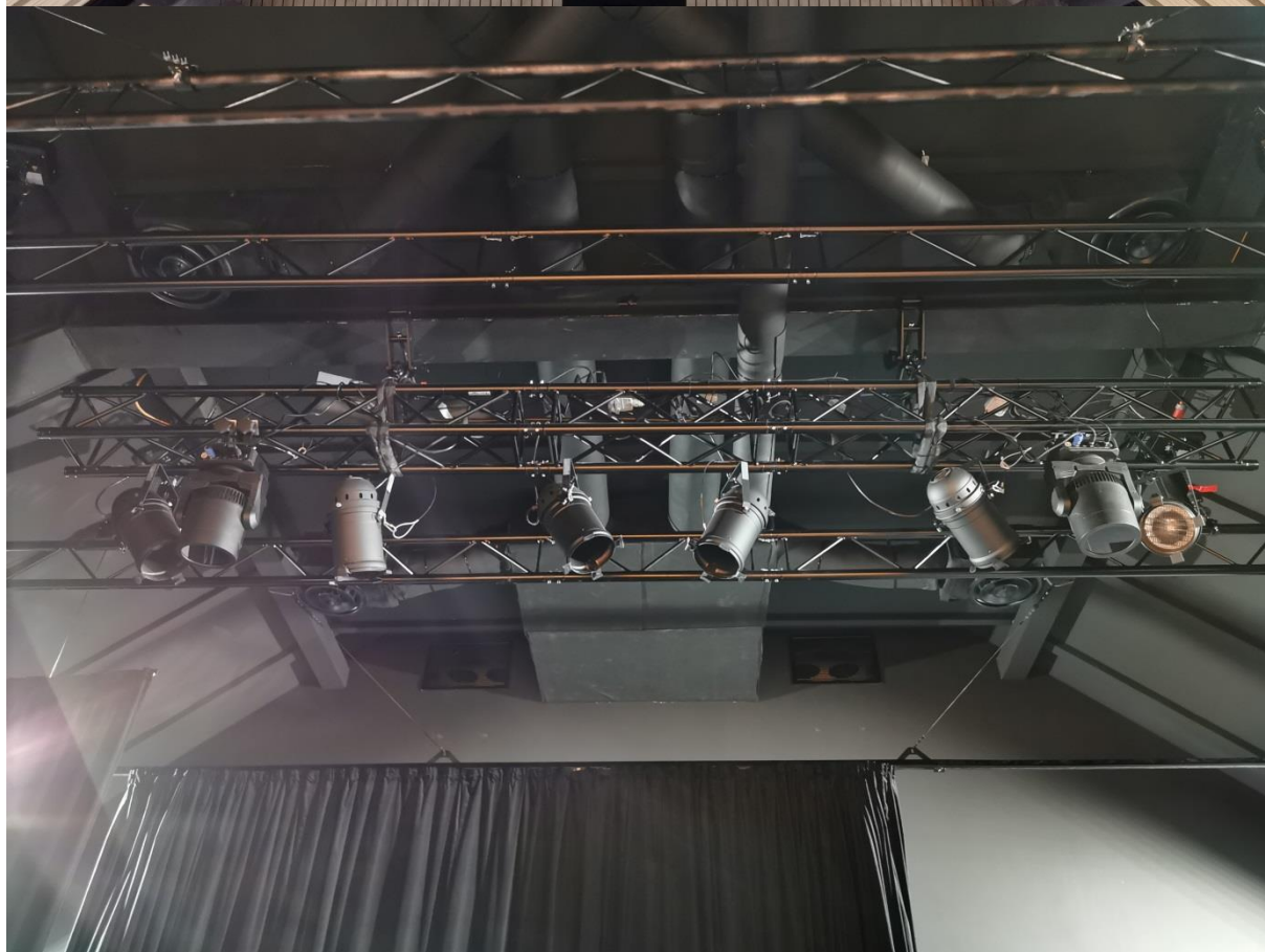
Zadní (kontra) světla